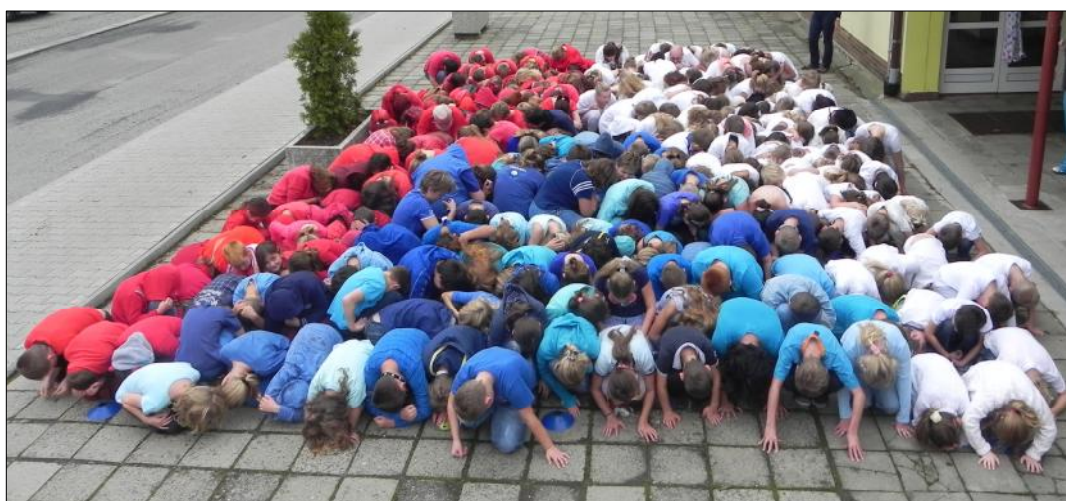
Národní den – Den barev – státní vlajka