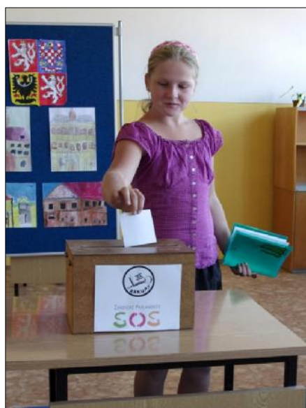
Volby do žákovského parlamentu