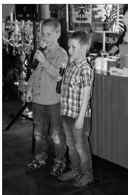
Pěvecká soutěž „Zákupský vrabčáček“