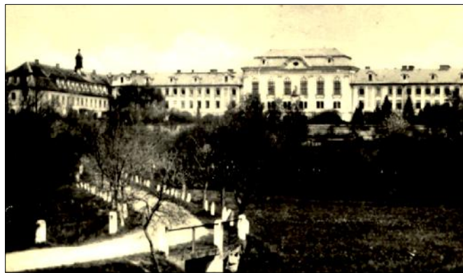
Obr. 1 : Vyšší lesnická škola v Nových Zákupcích

ké školy (obr. 1) z Bělé pod Bezdězem do objektu v Nových Zákupcích.