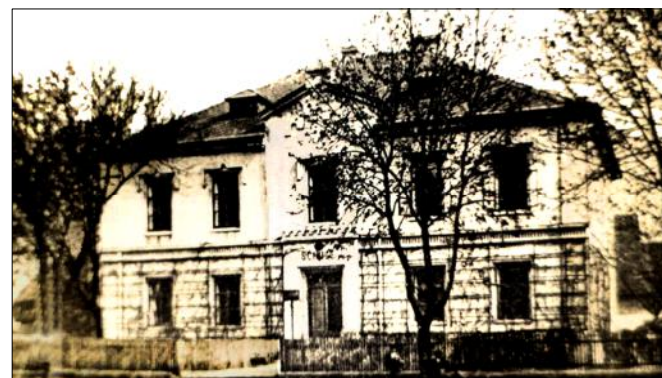
Obr. 2 : Škola v Brenně

Jak již bylo uvedeno, nejstarší zápis o škole má Brenná