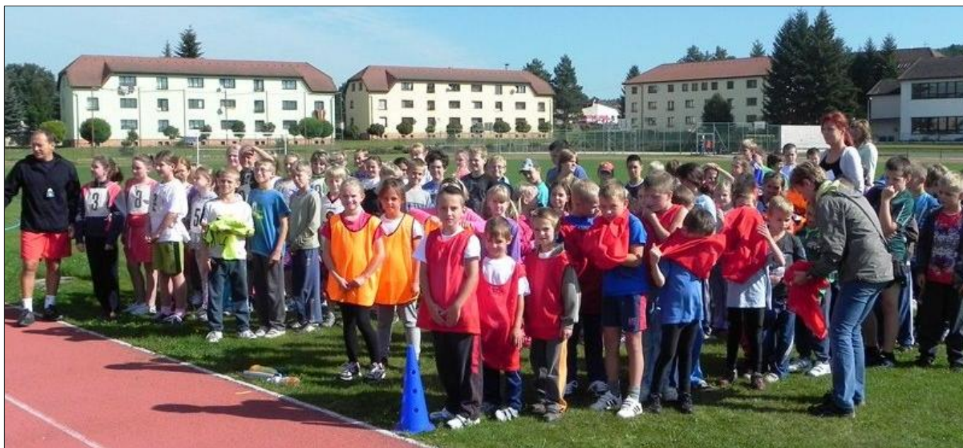
Štafetové závody – Zátokova pětka a Zátokova desítka