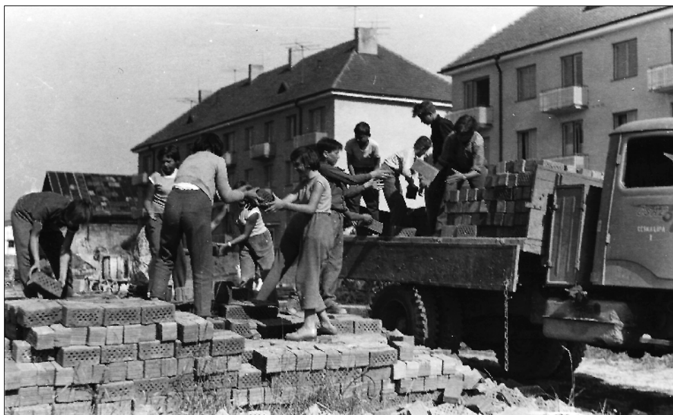
Obr. 5: Děti pomáhají při stavbě nové školy - 1962