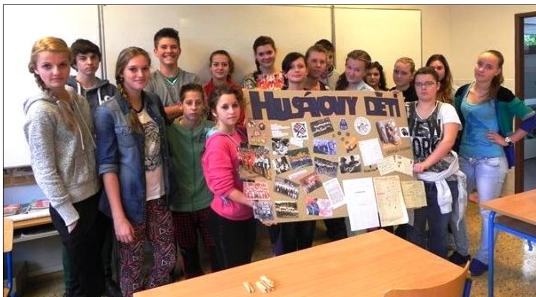
Nejsem tu sám – 17. listopad