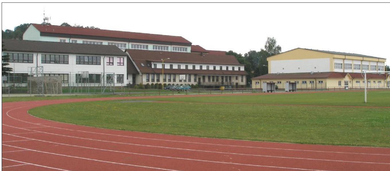
Obr. 10: Budova školy na sídlišti - rok 2009