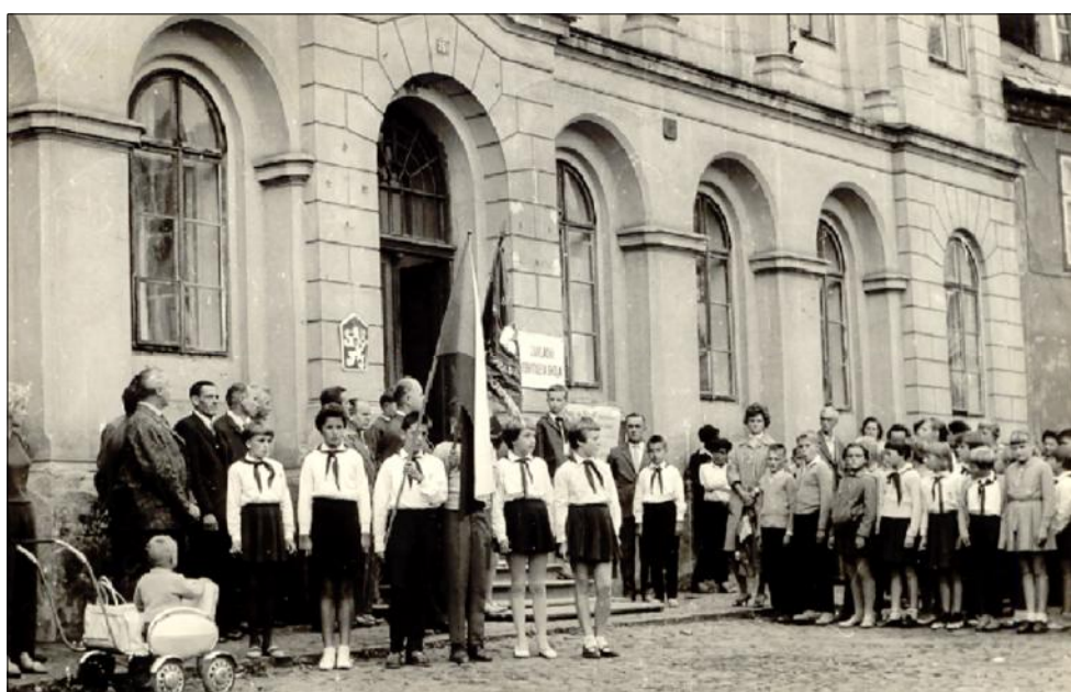
Obr. 7: Odchod ze staré školy na náměstí