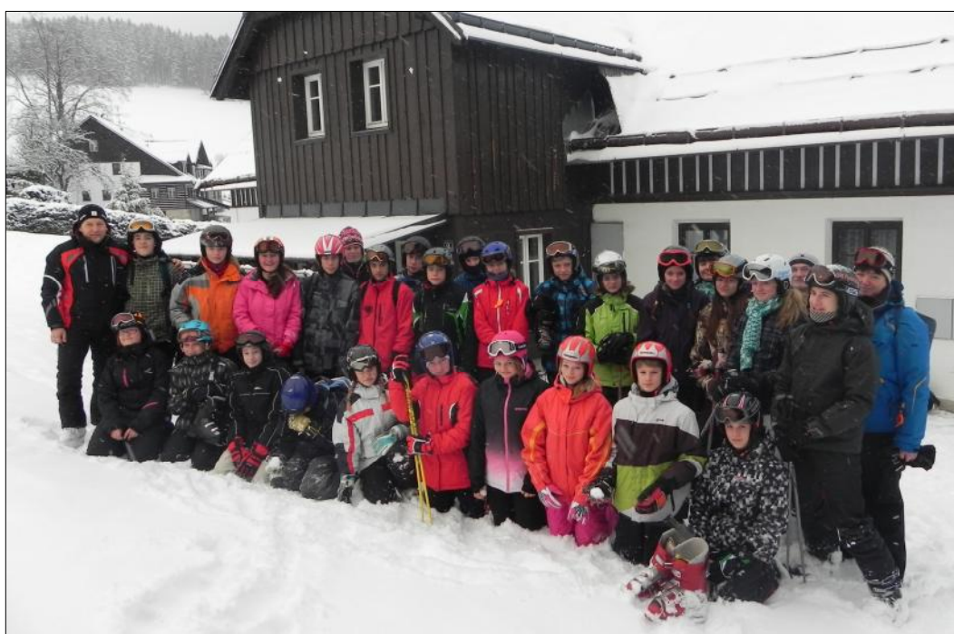
Lyžařský kurz žáků 7. tříd