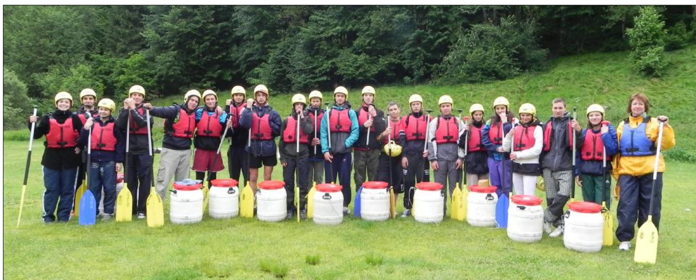
Vodácký kurz žáků 9. tříd