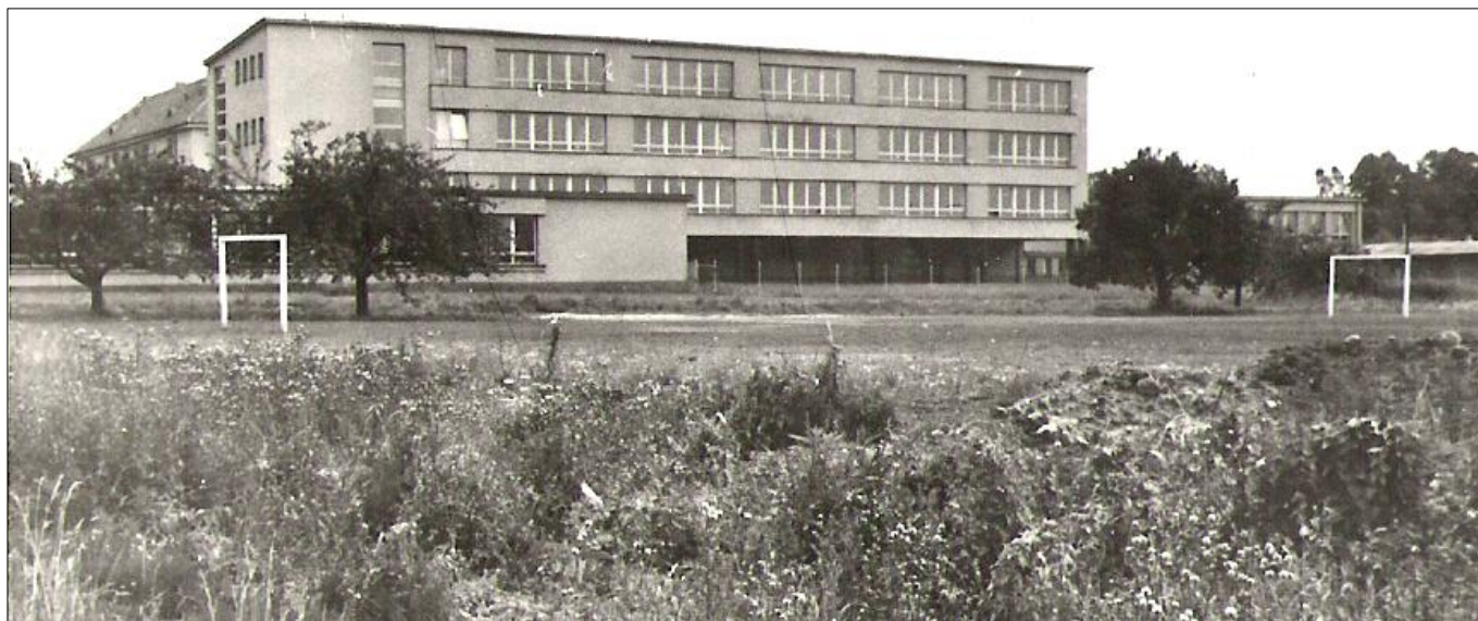
Obr. 9: Budova školy na sídlišti - rok 1964