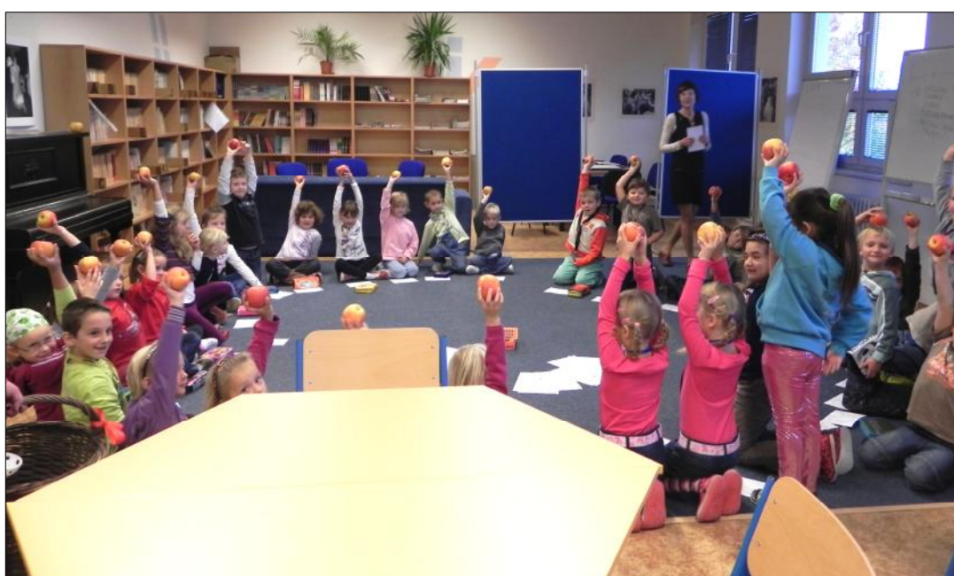
Světový den výživy