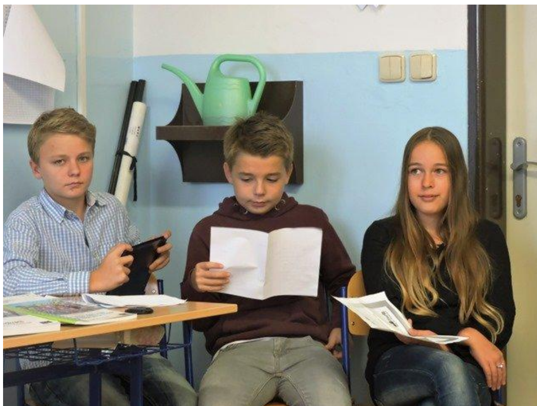
Exkurze – Drážďany