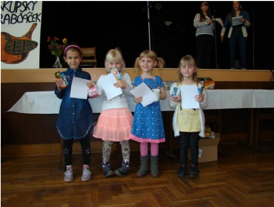
Memoriál Jindřicha Cardy ve skoku vysokém