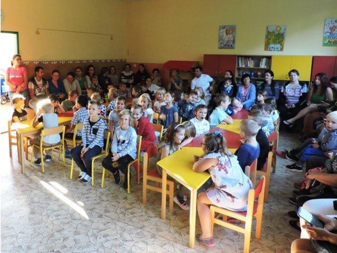
Pasování prvňáčků na rytíře školy