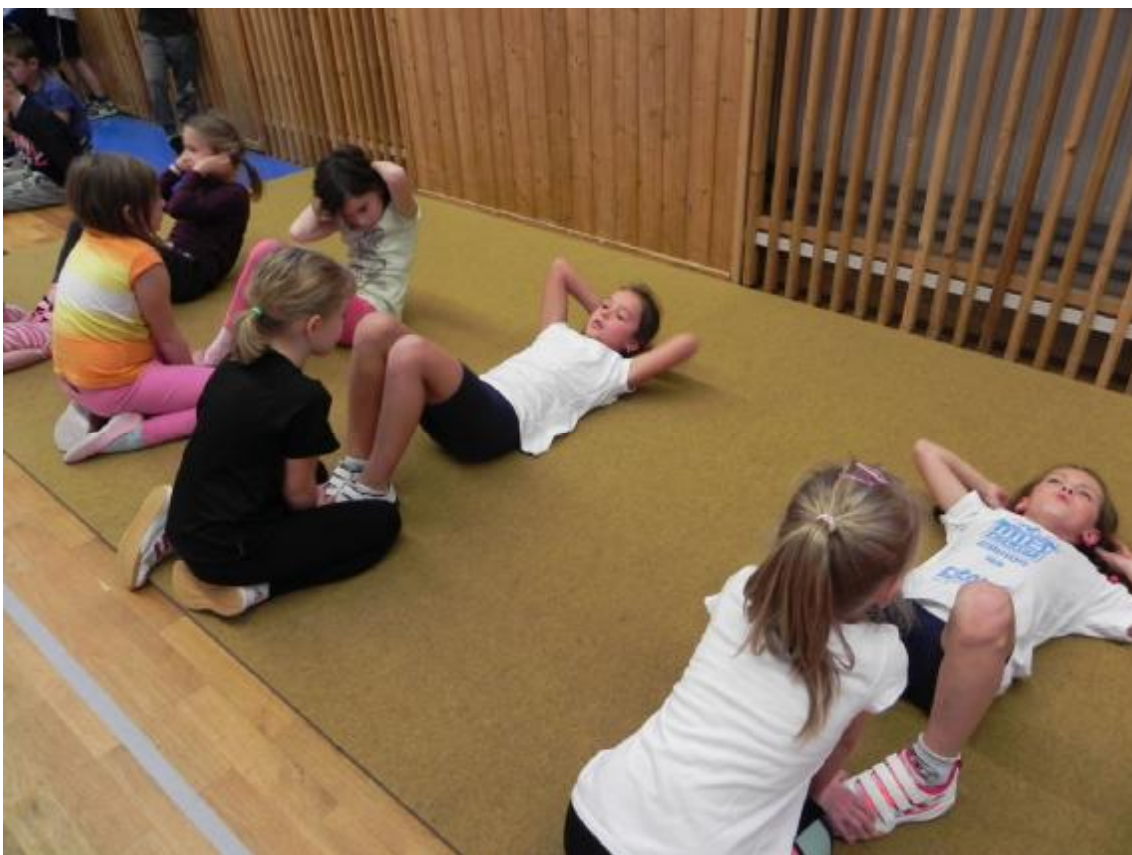
Návštěva žakovského parlamentu v Senátu ČR