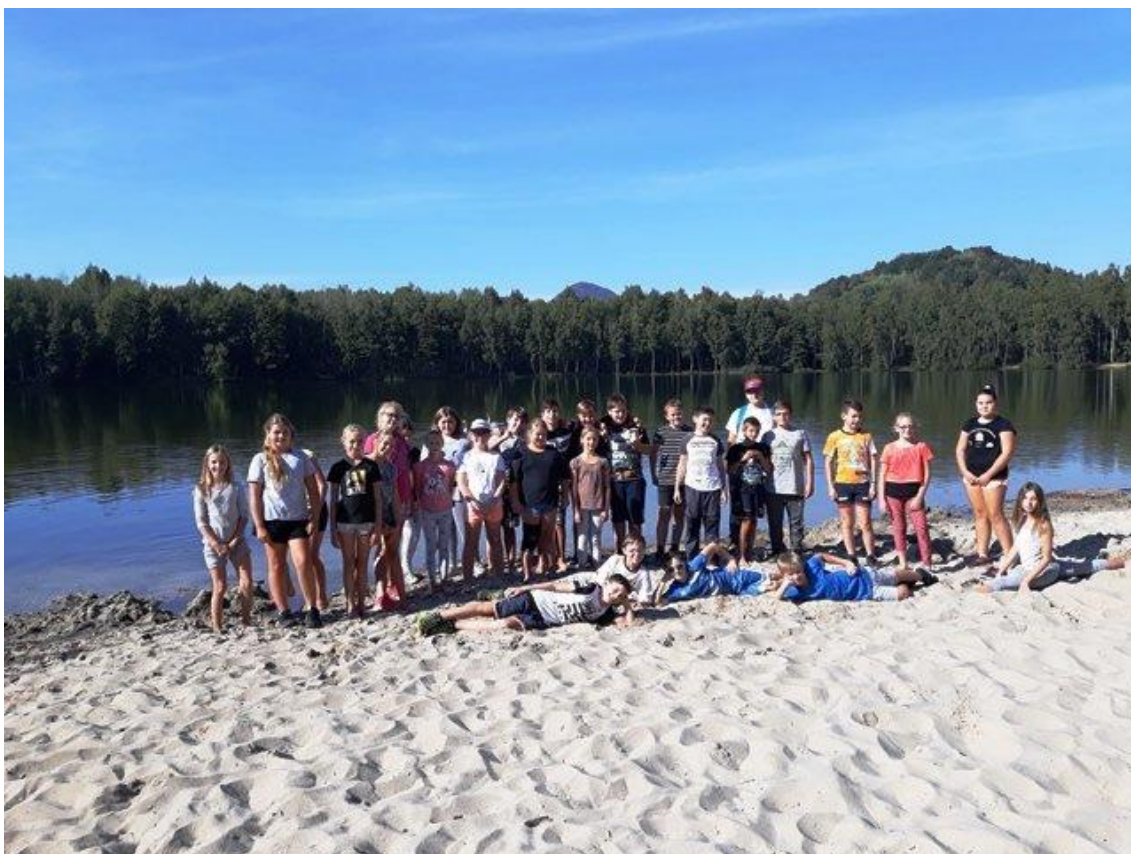
Seznamovací pobyt 1. tříd – Sloup v Čechách