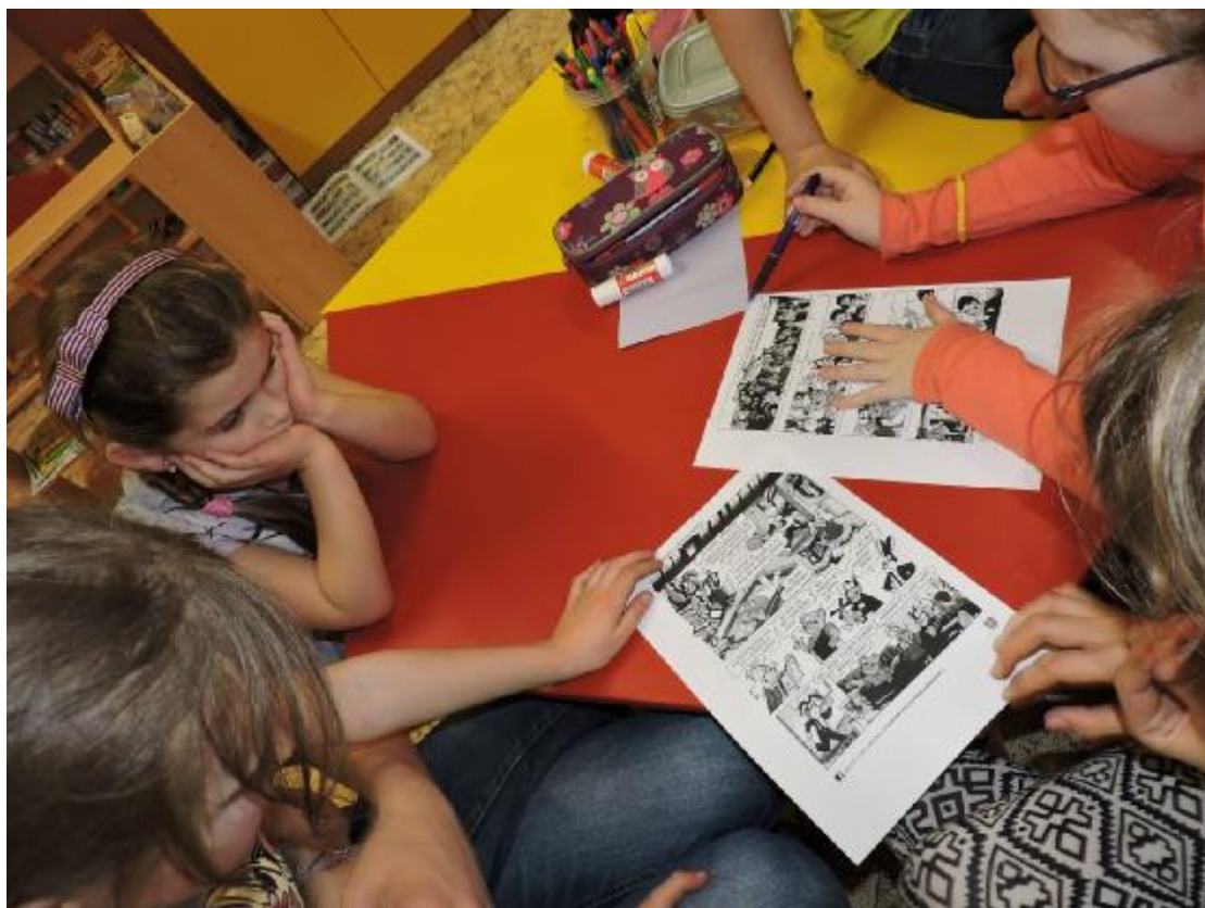
5.4.2017 Zápis do 1.tříd