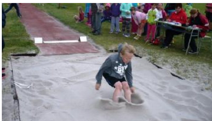
Pěvecký kroužek – „Zákupáček“