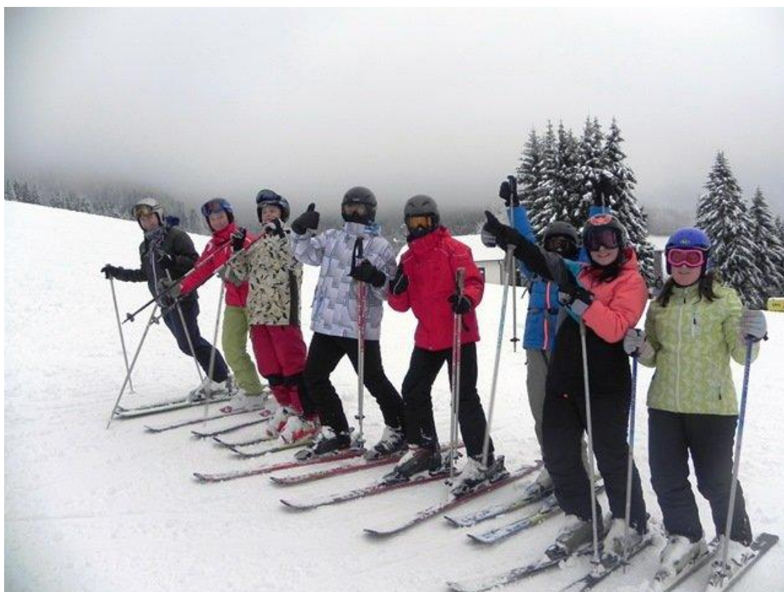
Sněhuláci pro Afriku