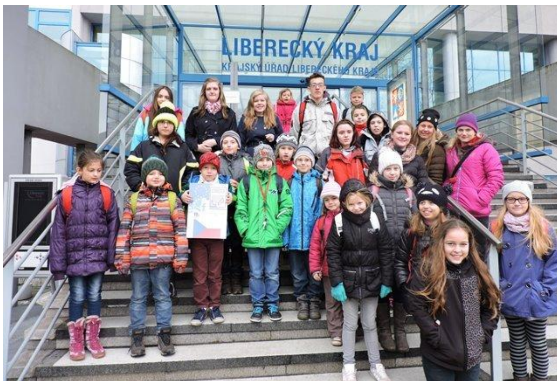
Okresní kolo OVOV – Zákupy