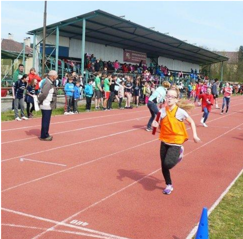
MS v zákupském hokeji