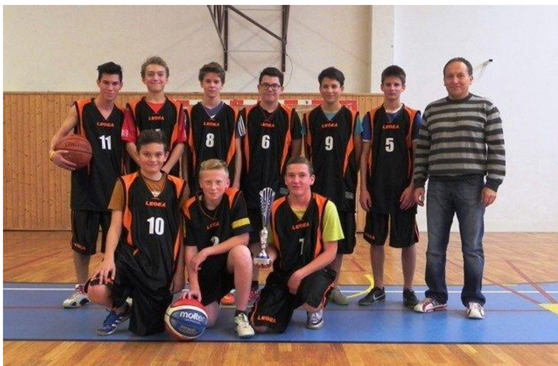
Návštěva žákovského parlamentu v senátu