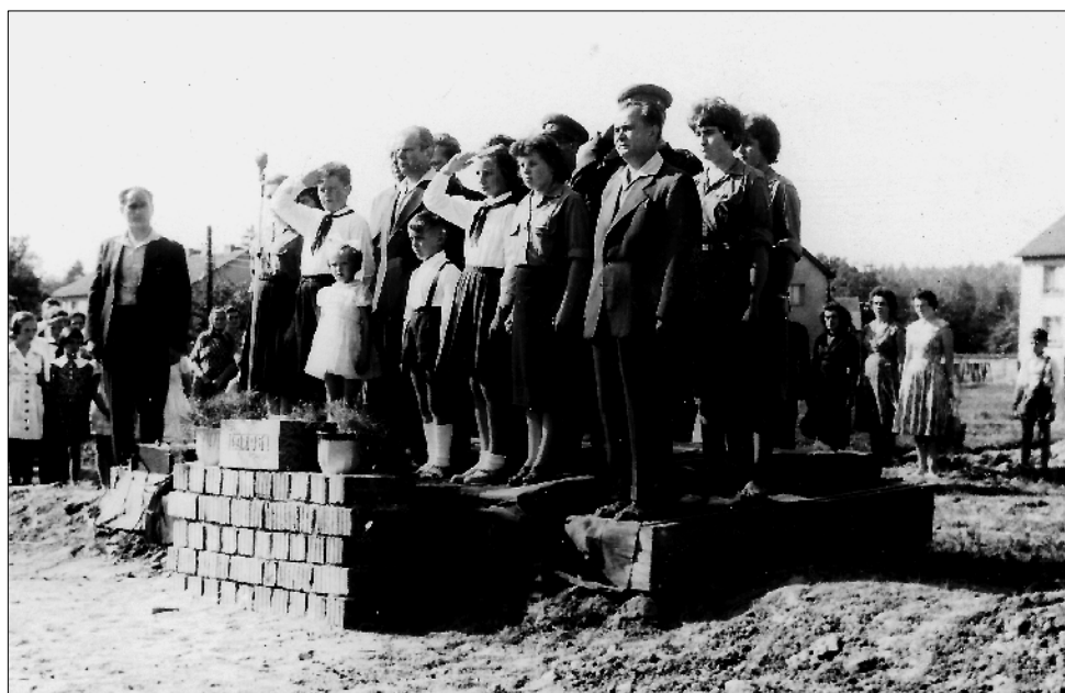
Obr. 6: Základní kámen k nové zákupské škole - 1. 9. 1961