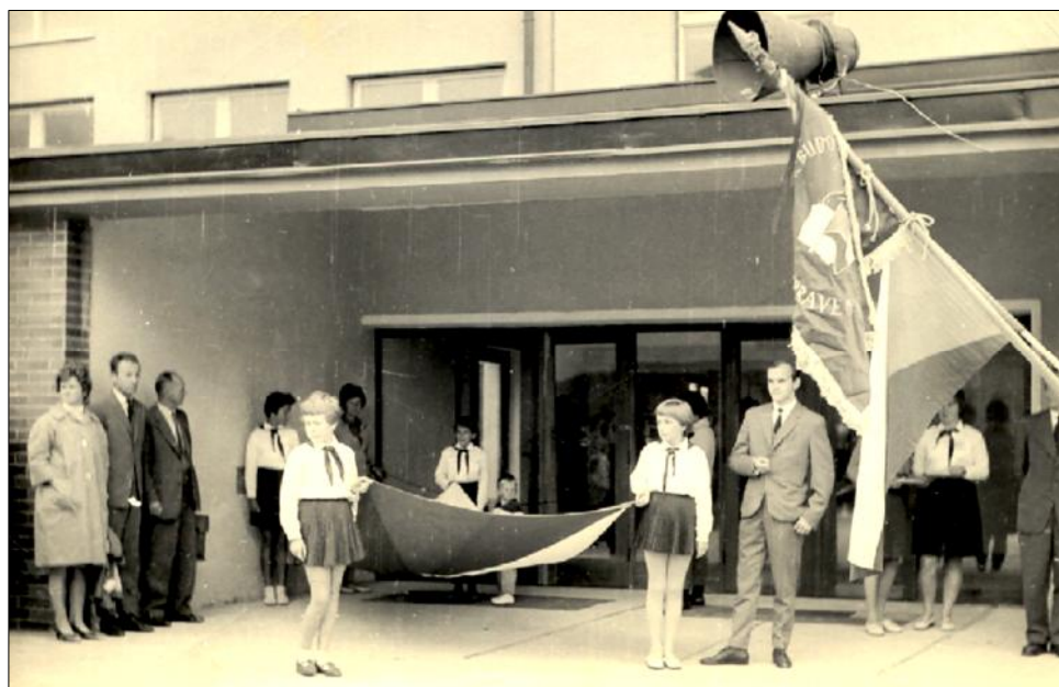
Obr. 8: Slavnostní otevření školy na sídlišti 1. 9. 1964