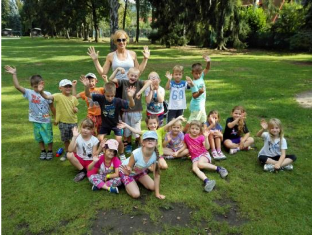
12.9.2016 Pasování prvňáčků