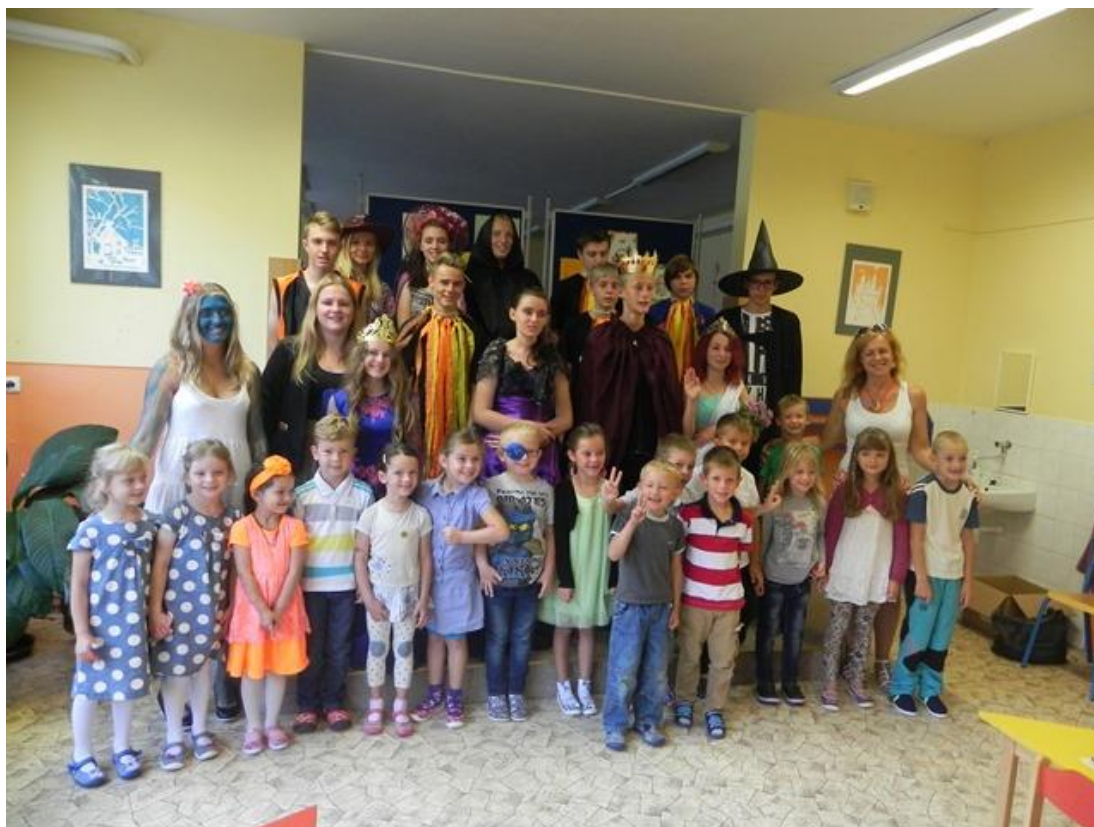
24.9.2016 Volby do Žákovského parlamentu