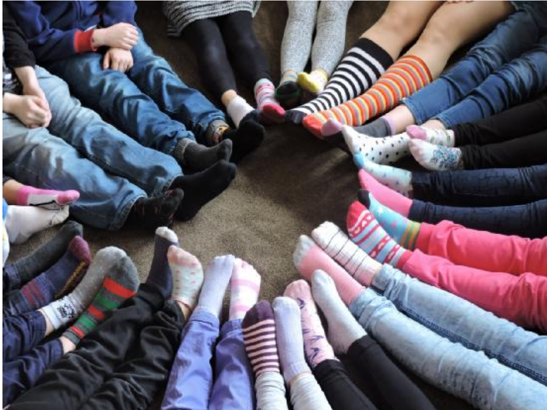
22.3.2017 Zákupský vrabčáček